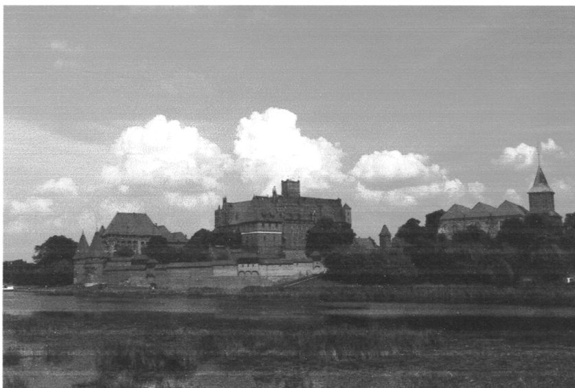
Zamek krzyżacki w Malborku

Zamek krzyżacki w Malborku został wpisany na listę UNESCO w 1997 roku na podstawie II, III i IV kryterium. Jest to największa twierdza w Europie. Istniał od XIII wieku ale zwiększony i urozmaicony został po 1309 roku w momencie, kiedy przeniesiono tu siedzibę Wielkiego Mistrza Zakonu Krzyżackiego. Zamek po raz pierwszy był odnowiony na przełomie XIX i XX wieku po wielu latach zaniedbania. Następnie po II wojnie światowej zamek w wyniku zniszczeń został odrestaurowany.