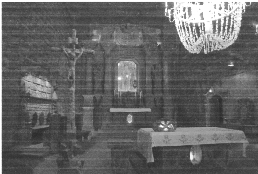
Kaplica św. Kingi w podziemiach Kopalni Soli w Wieliczce

Kopalnia w Wieliczce trafiła na listę UNESCO w 1978 r. w pierwszej grupie obiektów z całego świata – tak samo jak Stare Miasto w Krakowie. W 2013 r. rozszerzono ten wpis o Kopalnię Soli w Bochni i Zamek Żupny w Wieliczce, na skutek czego została zmieniona nazwa wpisu na obecny. Wpis obiektów na tę listę został dokonany na podstawie IV kryterium. Złoże soli kamiennej w Wieliczce wydobywane są od XIII w. Jest to najstarszy tego typu obiekt w Europie. Kopalnia obejmuje 9 poziomów. Pierwszy znajduje się na 64 metrach, a ostatni – na 327 metrach. Dokładnie 3 000 wyrobisk połączonych jest 360 kilometrami chodników. Pod ziemią można zobaczyć Kaplicę św. Kingi (101 metrów pod ziemią), która jest największą podziemną świątynią na świecie. Dodatkowo znajdują się wyrzeźbione w soli ołtarze, posągi i inne dzieła sztuki. Natomiast Kopalnię w Bochni charakteryzują trzy szyby górnicze – Sutoris (z poł. XIII w.) – najstarszy istniejący w Polsce, Campi (z poł. XVI w.) i Trinitatis (z pocz. XX w.) oraz podziemne kaplice i inne miejsca kultu religijnego.