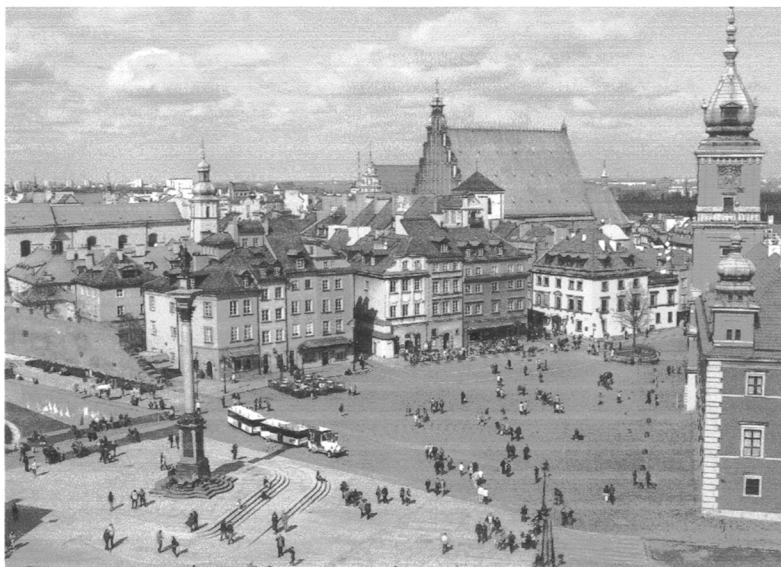
Część Starego Miasta w Warszawie

W uzasadnieniu napisano, że obiekt stanowi wyjątkowy przykład renowacji zabytków, które niemal w całości zostały zniszczone. Podczas Powstania Warszawskiego w sierpniu 1944 roku 85% historycznego centrum Warszawy zostało zniszczone przez hitlerowskie wojska. Po wojnie zaczęto odbudowywać oraz odrestaurowywać kościoły, pałace oraz Rynek Starego Miasta. Wszystkie zabytki w obrębie obiektu wpisanego na listę pochodzą z okresu od XIII do XX wieku.