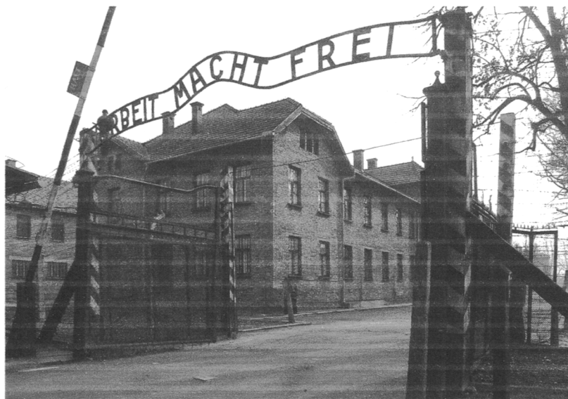
Niemiecki nazistowski obóz koncentracyjny i obóz zagłady - Auschwitz-Birkenau

jako obóz dla więźniów politycznych, który z czasem rozrósł się i zmienił funkcję. Na terenie obozu występują ogrodzenia, druty kolczaste, wieże strażnicze, szubienice, komory gazowe i krematoria świadczące o okrucieństwie nazistów. Ukazują one warunki życia więźniów oraz ludobójstwo, które się tam dopuszczono. Przypuszcza się, że głodzono, torturowano i wymordowano tam ok. 1,5 miliona ludzi (większość z nich to byli Żydzi).