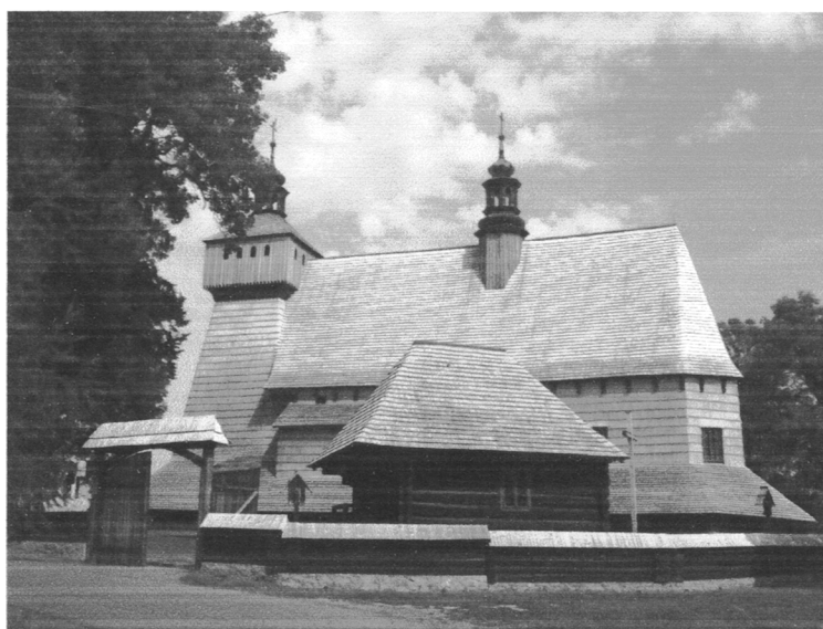
Kościół w Haczowie

Zostały wpisane na listę UNESCO w 2003 roku na podstawie III i IV kryterium. Świątynie znajdują się we wsiach Binarowa, Blizne, Dębno, Haczów, Lipnica Murowana i Sękowa. Są one drugim najstarszym skupiskiem drewnianych kościołów w Europie (zaraz po kościołach klepkowych z Norwegii). Większość z nich położona jest na Szlaku Architektury Drewnianej. Są one przykładem różnych aspektów tradycji budowlanych kościołów średniowiecznych w kulturze rzymsko-katolickiej. Wybudowane zostały zgodnie z zasadami techniki zrębowej, która rozpowszechniana była w Europie Północnej i Wschodniej od średniowiecza. Fundatorami kościołów były rodziny szlacheckie. Jako pierwszy został wybudowany kościół Wniebowzięcia Najświętszej Maryi Panny w Haczowie (woj. podkarpackie) – 1388 rok. Uznawany jest za najstarszą świątynię gotycką z drewna w Europie.