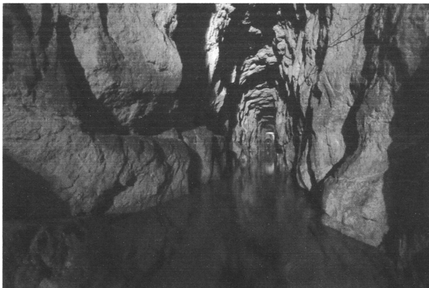
Sztolnia Czarnego Pstrąga

Na liście UNESCO znajduje się od 2017 roku na podstawie I, II i IV kryterium. Położona jest na Górnym Śląsku - jest to jeden z głównych regionów wydobywczych w Europie Środkowej. Obiekt znajdujący się na tej liście obejmuje w całości podziemną kopalnię (ze sztolniami, szybami, galeriami oraz systemem gospodarowania wodami podziemnymi). Dodatkowo obejmuje znajdującą się na powierzchni przepompownię parową z XIX wieku. Jej zadaniem było odprowadzanie wody z kopalni od ponad 300 lat. Odprowadzana woda wykorzystywana była do zaopatrywania miasta w wodę pitną oraz do użytku przemysłowego. Kopalnia w Tarnowskich Górach miała znaczący udział w produkcji cynku i ołowiu na świecie. Znajdujący się szlak turystyczny w Kopalni Srebra przebiega 40 m pod ziemią. Część trasy (300 metrów) trzeba pokonać łodzią.