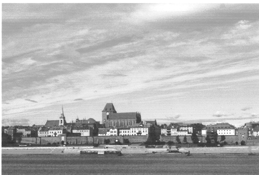
Średniowieczny zespół miejski Torunia

Obszar został wpisany na listę w 1997 roku na podstawie II i IV kryterium. Miasto powstało dzięki działalności Zakonu Krzyżackiego, który w poł. XIII wieku zbudował tu zamek. Miał on służyć za bazę do podboju i ewangelizacji Prus. W późniejszym czasie miasto pełniło istotną funkcję handlową. W całym mieście znajduje się ponad 1100 budowli zbudowanych w stylu gotyckim. Miasto należy do Europejskiego Szlaku Gotyku Ceglanego.