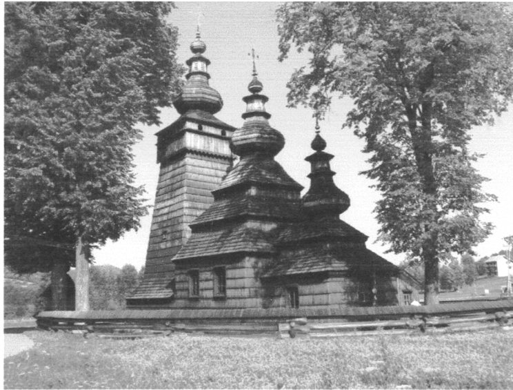
Cerkiew św. Paraskiewy w Kwiatoniu

św. Michała Archanioła w Brunarach Wyżnych (Małopolska). Cerkwie mają konstrukcję zrębową. Powstały w okresie od XVI do XIX wieku. Są to świątynie społeczności wyznania prawosławnego i grecko-katolickiego. Według typów architektonicznych wyróżnia się cerkwie halickie, łemkowskie, bojkowskie i huculskie.