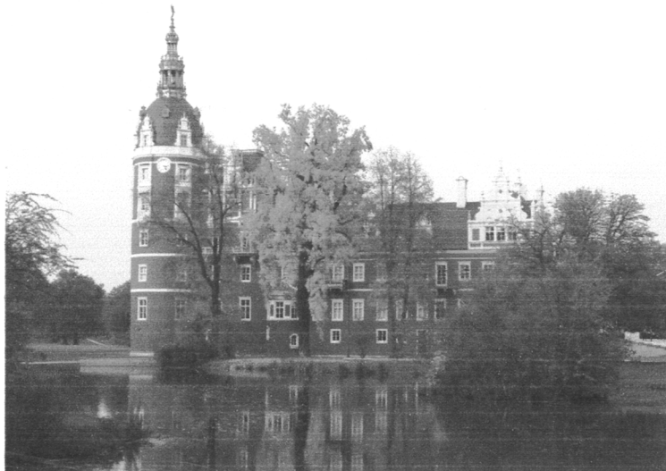
Nowy Zamek w Mużakowie