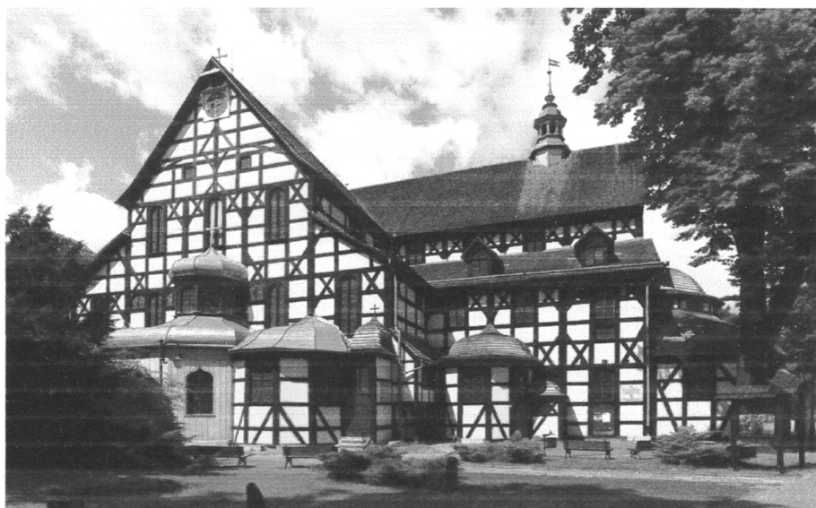
Kościół Pokoju w Świdnicy

Kościół Pokoju zostały wpisane na listę UNESCO w 2001 roku na podstawie III, IV i VI kryterium. Są to największe w Europie budowle sakralne o konstrukcji szkieletowej, które zostały wzniesione w połowie XVII w. na Śląsku. Powstały w efekcie zawartego Pokoju Westfalskiego po Wojnie Trzydziestoletniej, który regulował kwestie religijne.