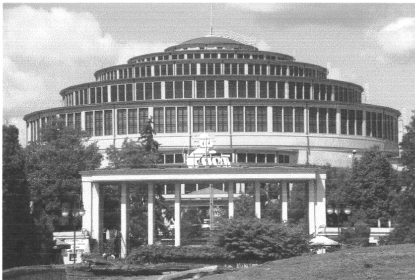
Hala Stulecia we Wrocławiu

Wpisana na listę UNESCO w 2006 roku na podstawie I, II i IV kryterium. Jest to budowla wzniesiona z żelazobetonu w latach 1911–1913 przez architekta Maxa Berga na terenach Wystawy Stulecia, podczas której Niemcy prezentowali historię i gospodarczy dorobek Dolnego Śląska. Stworzył on wielofunkcyjną budowlę na planie koła. Wewnątrz Hali Stulecia stanęły największe na świecie organy. Obecnie ich część znajduje się we wrocławskiej Archikatedrze, a kolejna - w Częstochowie. Hala może pomieścić 6 000 osób na widowni.