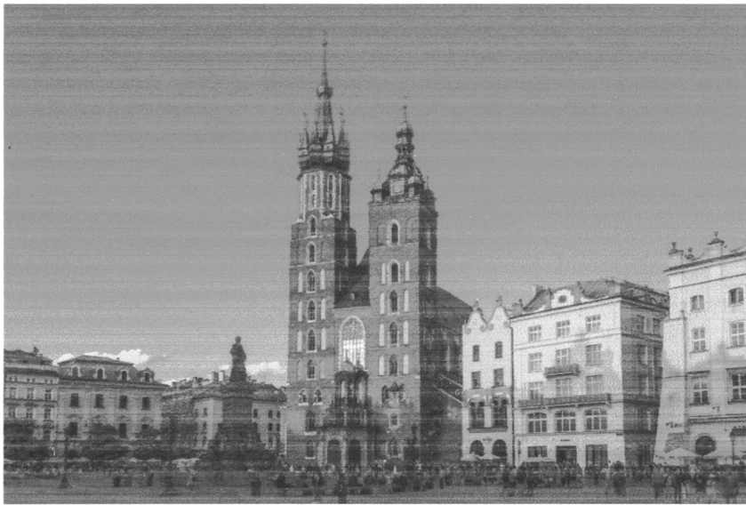
Rynek Główny w Krakowie